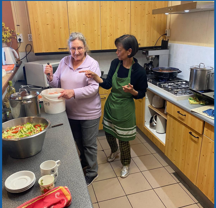
koken in de keuken door vrijwilligers

Hebt u ideeën of vragen over deze nieuwsbrief of wilt u een rol spelen in ons initiatief, neem dan gerust contact op met een van onderstaande bestuursleden. Zij horen graag uw reacties.